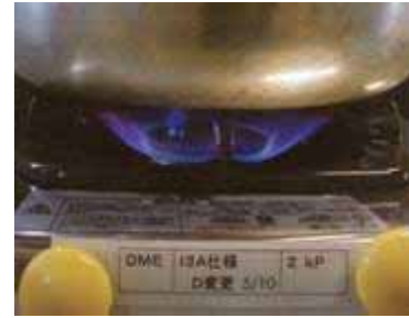
民生用(家庭用など)コンロによるDMEの燃焼 (都市ガス・13A使用、ダンパー開度 5/10)

炭素と炭素を酸素がつかないエーテル結合が特徴です。どのような燃焼の仕方をして、黒煙・PM(微粒子)を発生しません。また、燃焼しやすく、ディーゼルエンジンのクリーンな軽油代替燃料として利用することができます。